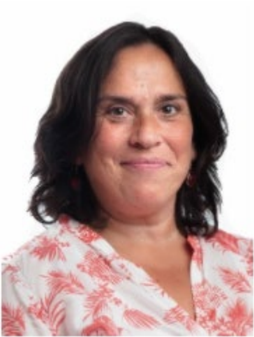
作者： Beatriz Luaces Åsgård 高級理賠主管，阿倫達爾