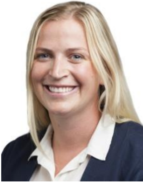
作者: Live Jacob Sydness 可持續業務經理